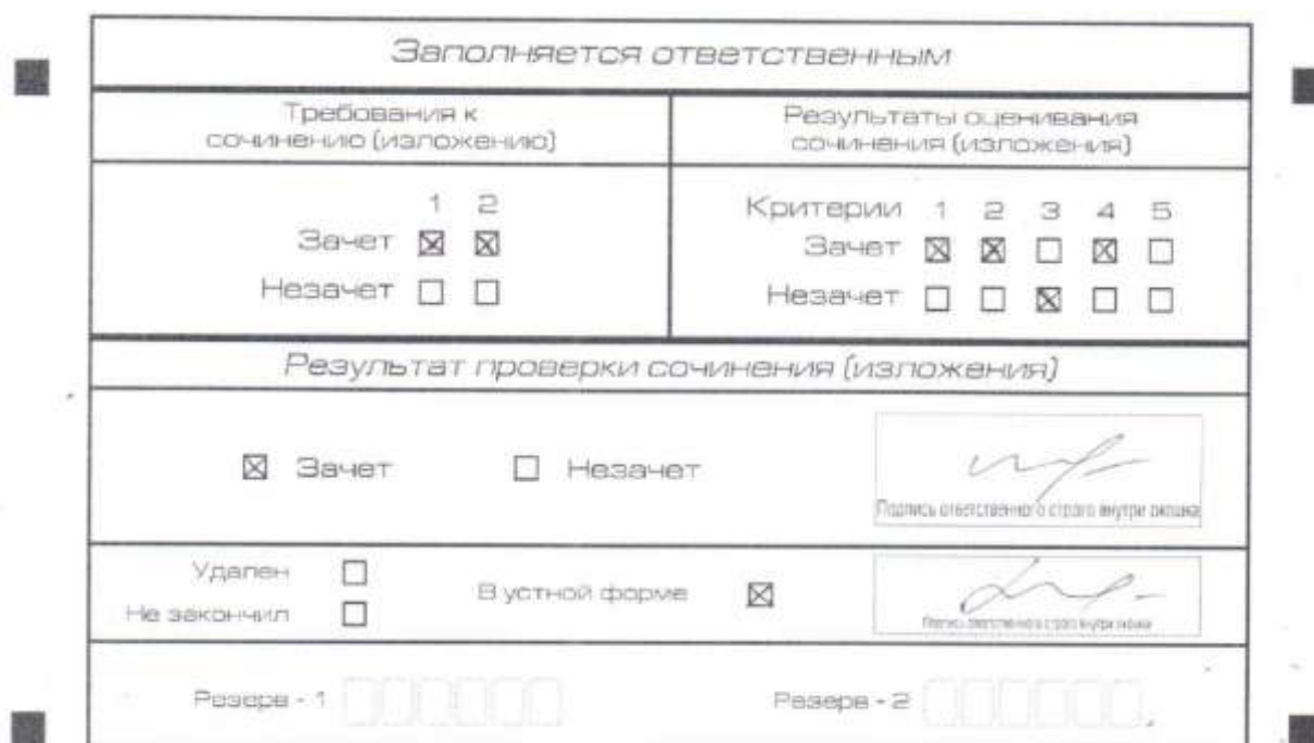
Рис. 9. Область для оценки работы сочинения (изложения) в устной форме

После окончания заполнения бланка регистрации ответственное лицо ставит свою подпись в специально отведенном для этого поле.